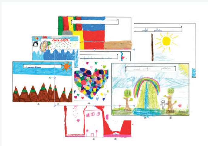
Les 10 dessins sélectionnés dans le collège San Antonio De Jesus

A la suite du retard scolaire engendré par la crise du covid, seules deux écoles ont pu participer au concours au Brésil et les 10 meilleurs dessins ont été sélectionnés pour deux expositions dans les deux écoles. En parallèle, fin juin une école liégeoise a également participé et prévoit d'organiser une exposition début septembre rassemblant les dessins brésiliens et belges. Les expositions au Brésil ont été l'occasion non seulement de créer un éveil sur la thématique de l'environnement mais également de distribuer de la nourriture et du matériel scolaire aux familles défavorisées.