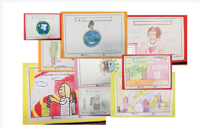
Quelques dessins des élèves de l'école Saint-Maur à Liège