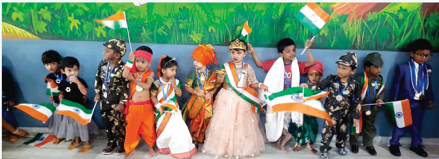
Les enfants de Mummy Home déguisés à l'occasion de la fête nationale indienne