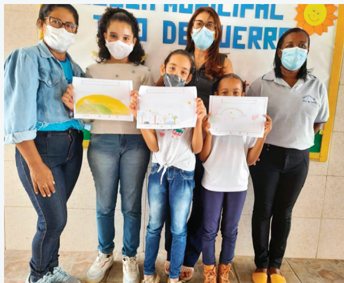
Enfants avec leur dessin de l'école Tirro de Guerra