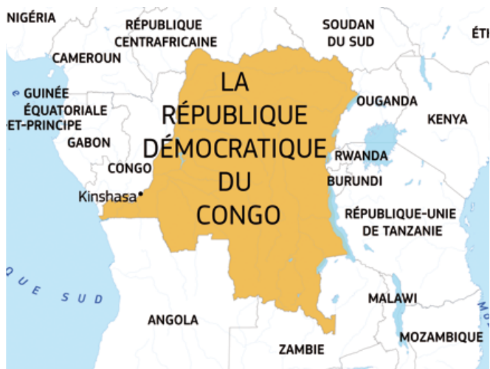
Figure 1 : Kinshasa, capitale de la République Démocratique du Congo (Sud-Ouest).