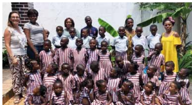
Figure 1 : Ndako Ya Bana au grand complet sur l'année académique 2018-2019

Près de la moitié des Kinois vivent sous le seuil de pauvreté et le taux de chômage y est important. Voici quelques chiffres explicites par rapport aux enfants :