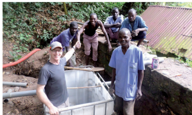
Pose du système de décantation

Si vous désiriez aider ce projet en particulier, nous vous invitons à verser directement sur le compte de SOS EA : BE58 0018 1947 5779. Ces dons sont cumulables avec les autres comptes SOS EA pour la dispense fiscale.