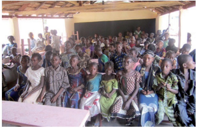
Inauguration du Centre en mai 2011 avec les enfants

PROJET « SOLIDARITE DJIGUYA », BURKINA FASO : SOUTIEN AU CENTRE D'ACCUEIL POUR LES ENFANTS ORPHELINS ET DÉMUNIS DE SINDOU