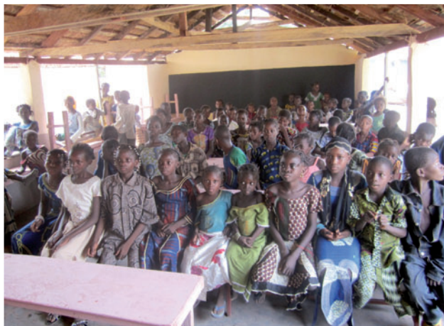
Inauguration du Centre en mai 2011 avec les enfants

Depuis, Séverine n'a cessé de suivre ce projet. Elle est retournée à Sindou fin 2017. Voici ce qu'elle nous dit de l'état actuel du projet et des besoins nouveaux que nécessite la poursuite de l'action :