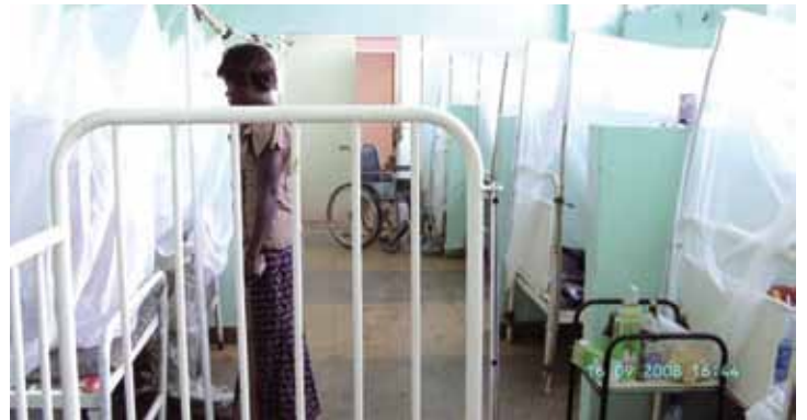
Een enkele verpleegster voor twaalf patiënten met zware brandwonden