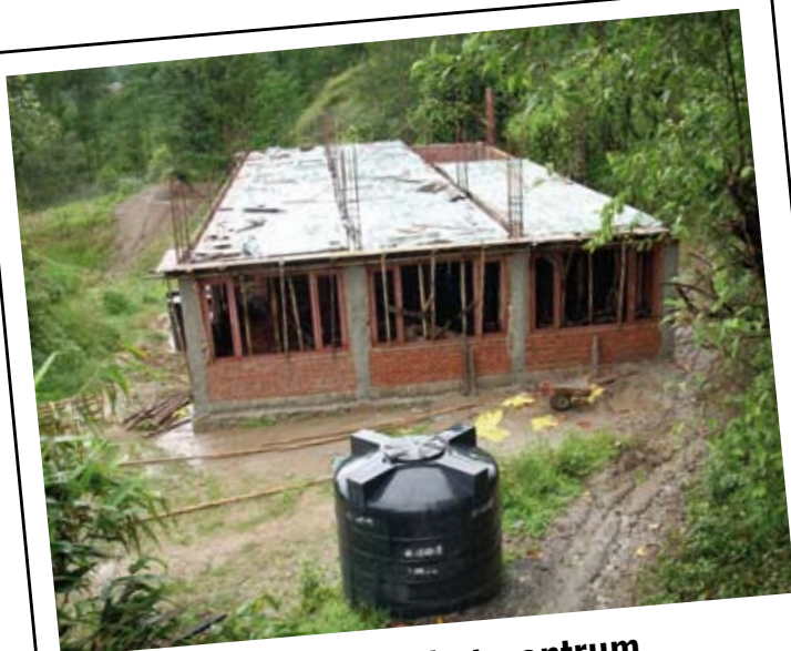
Het huis en het centrum in aanbouw in Kakani

Bezoek onze website : www.sosenfantsabandonnes.be