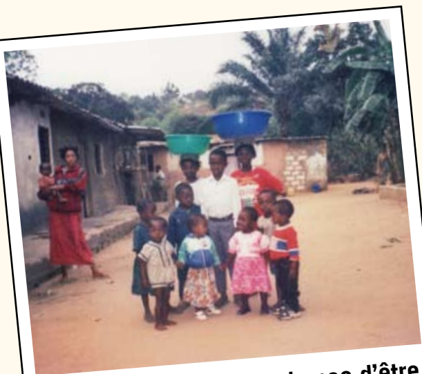
Ces enfants ont eu la chance d'être récupérés dans la rue