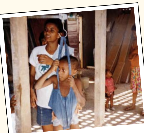
La pesée des enfants

Plusieurs pays d'Afrique (Angola, Mozambique) s'efforcent d'ailleurs de copier le modèle brésilien. La Pastorale de l'Enfant du Brésil est candidate depuis plusieurs années au Prix Nobel de la Paix.