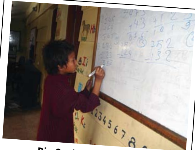
Die Sozialisierungs- und Alphabetisierungskurse ermöglichen es Dutzenden von Straßenkindern gewisse Grundkenntnisse zu erwerben

Mit dem Bau wurde angefangen, aber es fehlt an Geld um das erste Stockwerk zu beginnen und auch das Erdgeschoss ist noch nicht fertig. Mit dem von SOS Verlassene Kinder aufbrachten Geld