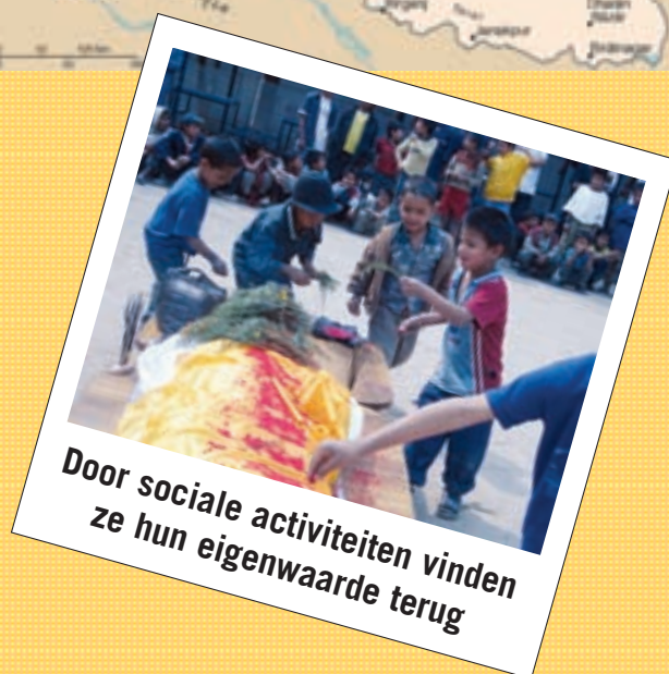
Door sociale activiteiten vinden ze hun eigenwaarde terug