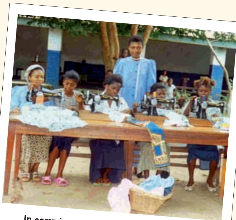
In sommige centra kunnen jonge meisjes leren naaien; zij weten dat ze "bevoorrecht zijn".

Indien u wenst ons te helpen bij de verspreiding van ons tijdschrift in uw parochie, gelieve dan met ons contact op te nemen; wij zullen u dan enkele exemplaren laten geworden. Ook onze dank hiervoor.