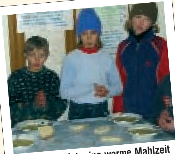
Einmal täglich eine warme Mahlzeit ausgeben zu können