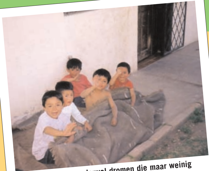
Kinderen boordenvol dromen die maar weinig kansen krijgen om uit de armoede te komen

De tweede doelstelling is de oprichting van een schooltje . Het is immers onverantwoord om de kinderen gewoon terug op straat te zetten na de kleuterschool. Een basisonderwijs is voor deze kinderen de enige kans om een betere baan te vinden en uit de sloppenwijk te geraken. Het maakt de kans ook groter dat ze aan de twee plaagen te ontsnappen die hen anders wellicht te wachten zouden staan : alcoholisme en vroegtijdige zwangerschap.