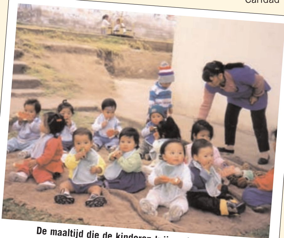
De maaltijd die de kinderen krijgen is vaak hun enige maaltijd van de dag